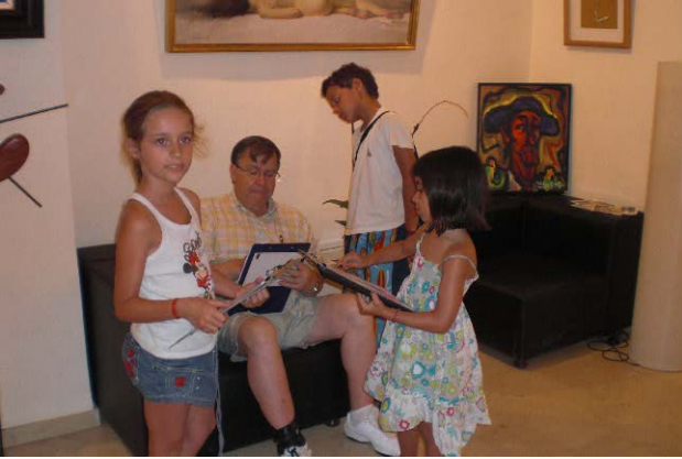
Der Künstler "Cozar" erklärt uns woarauf man beim Malen achten muss. El artista "Cozar" nos explica como se dibuja un cuadro.