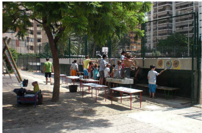
In Form eines Mosaiks bringen wir Kandinskis Farbkreise an die Wand unseres Pausenhofes. En forma de un mosaico pegamos los círculos de colores de Kandinski en la pared de nuestro patio de recreo.